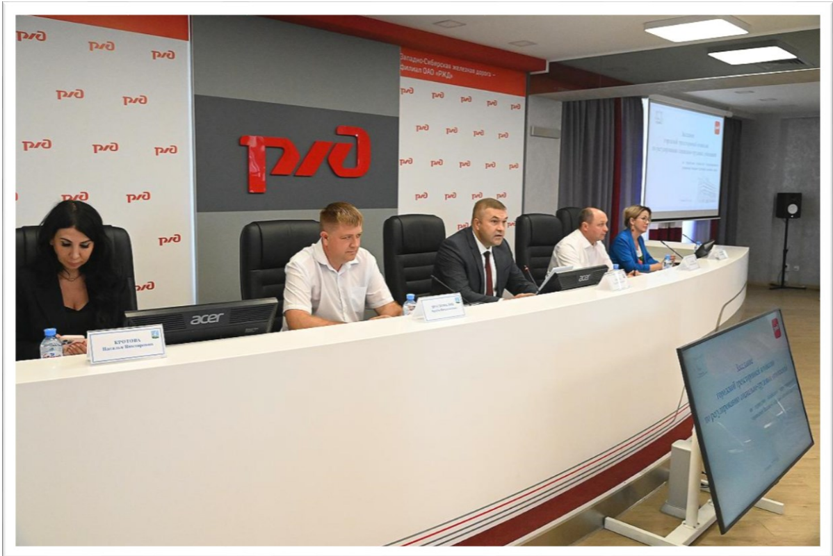
Фото 2. Выездное заседание на территории Алтайского территориального управления Западно-Сибирской железной дороги.