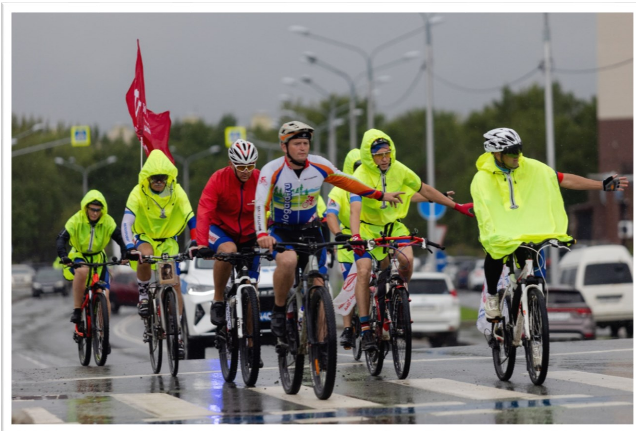
В 2025 году РОСПРОФЖЕЛ провел спортивно-патриотический велопробег «Две Победы».

В 2025 году в честь 80-летия Победы над фашистской Германией и милитаристской Японией, 120-летия РОСПРОФЖЕЛ прошла спортивно-патриотическая акция – велопробег «Две Победы».