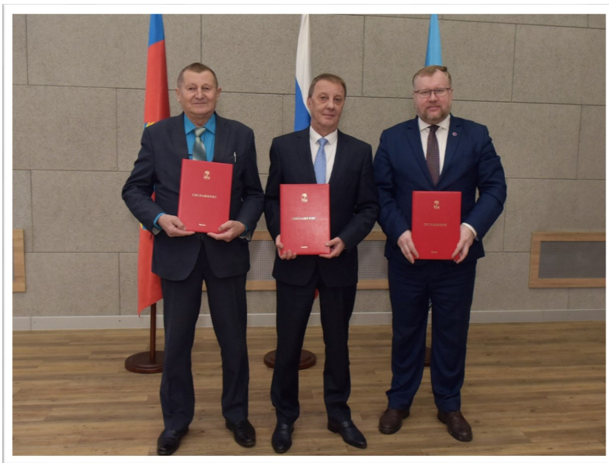
Фото 1. Подписание городского трехстороннего соглашения.

Зимняя встреча участников трехсторонней комиссии состоится в КАУ «Дом народов Алтайского края». В 2026 году, объявленном Президентом России В. В. Путиным Годом единства народов России, в планах социальных партнеров рассмотреть деятельность национально-культурных объединений в социальной адаптации трудящихся-мигрантов.