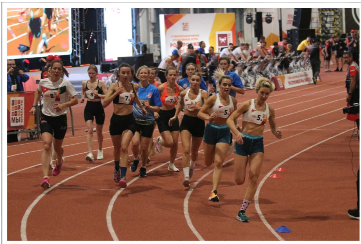
Эстафета ГТО – обязательная дисциплина Железнодорожных спортивных игр РОСПРОФЖЕЛ «Мы вместе».

Профсоюз содействует организации работы по страхованию работников от утраты профессиональной трудоспособности, а также развивает программу лояльности.